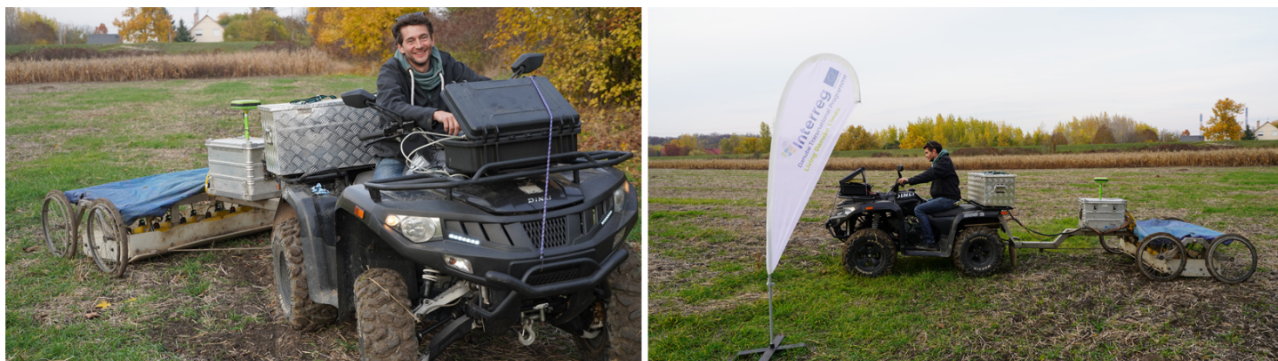
Slike: LBI ArchPro: Arheološka geofizička prospekcija za potrebe projekata Living Danube Limes

Ovi veoma osetljivi instrumenti mogu da detektuju zakopane strukture kada su njihova fizička svojstva merljivo u suprotnosti sa njihovom okolinom, kao što su kameni zidovi i razne prostorne postavke, jame, otvori i kamini. Za potrebe analiza u okviru projekta, tim je primenio motorizovane sisteme za merenje više senzora koji mogu da pokriju velike površine za kratko vreme i stoga imaju veliki potencijal za efikasno istraživanje arheoloških pejzaža.