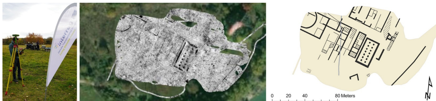
slika levo: Postavljanje GPR sistema u Sasalombati; slika u sredini: Istraživano polje na prostoru rimske tvrđave; slika desno: Tumačenje GPR podataka koji pokazuju rimske građevinske strukture.

Na mađarskoj pilot lokaciji Százhalombatta-Dunafüred ( Matrica ) tim za rad na terenu sproveo je istraživanje GPR-a u bivšem rimskom logoru, kadi i vikusu. Na GPS podacima i snimcima u oblasti vikusa, može se primetiti nekoliko rimskih kuća (neke sa kamenim podnim pločnicima) i susedna poljoprivredna polja. U okviru Rimske tvrđave odlični rezultati GPR-a otkrili su masivne rimske zidove, stubove i zgrade koje se mogu dodeliti fazi logora. Strukture pokazuju tipične kopnene planove koji se mogu uporediti sa poznatim rimskim građevinskim elementima kao što su dvorišta, kasarne i granate.