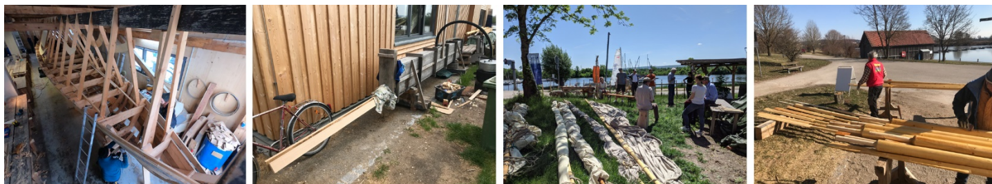
slika druga sa desne strane: gotovi rogovi su predstavljani tokom treće radionice, maj 2022.

Radili smo i na proizvodnji vesala u kategorijama od 4,1m, 4,4m i 4,7m.