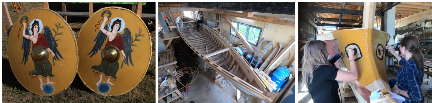
Autori slika: FAU; Slika levo: dva završena štita, predstavljena prilikom prezentovanja Danuvije Alakris, jun 2022.

Radovi na brodu nastavljeni su dodavanjem podnih ploča i konstruktivnih okvira. Dodate su i poslednje daske u zadnjem delu. Zatim su šabloni izbijeni i u njih su umetnute trake koje nedostaju, rebra i donji okviri. Onda su zakucani poslednji gvozdeni ekseri. Nakon toga dodate su daske po dužoj strani broda, tačnije 3 sa desne i 3 sa leve strane. Paluba se zatim oslonila na donju gredu. Dva gornja elementa su šira i jača nego u originalu, jer se čamac - suprotno istorijskim činjenicama - često transportuje na kopnu.