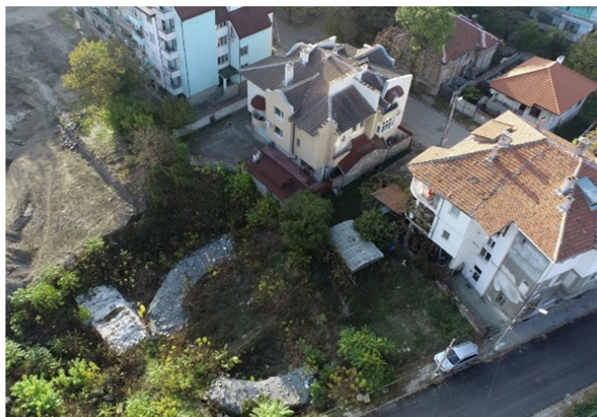
slika desno: Zapadna kapija Romanske tvrđave Bononija, grad Vidin, Bugarska

Sastanak je nastavljen radionicom o unapređivanju vidljivosti Rimskog dunavskog Limesa. Radionica pod nazivom "Bononija – oživljavanje prošlosti kroz virtualne rekonstrukcije" pružila je interakciju između partnera projekta, pridruženih partnera, lokalnih vlasti, predstavnika kulturnih centara i drugih lokalnih zainteresovanih strana u potrazi za najboljim mogućim načinima za predstavljanje bugarske pilot lokacije 3D virtualnim rekonstrukcijama koje su već razvijene u okviru projekta.