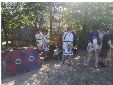
Autori slika: BME