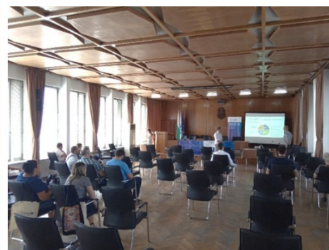
Slika levo: Virtualna rekonstrukcija Bononije (autor slike: Slovački tehnološki univerzitet u Bratislavi, Slovačka), Konferencija-autori slika levo i u sredini Nacionalni turistički klaster "Bugarski vodič" (NTC BG Guide)