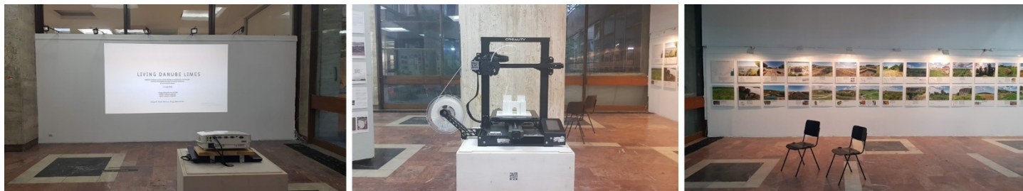
Autori slika: UAUIM

Izložba je bila otvorena tokom Dana dunavskog Limesa (20-26. jul 2022. godine), sa mogućnošću da ostane otvorena i dostupna javnosti do jula 2022. godine. U nastavku su prikazane slike sa izložbe.