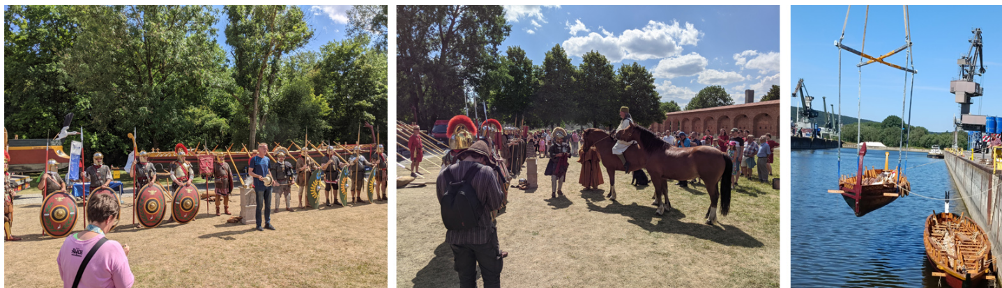
Autor slika levo i u sredini: FAU

Potom smo otišli u Kelhajm, gde je čamac spušten u Dunav.