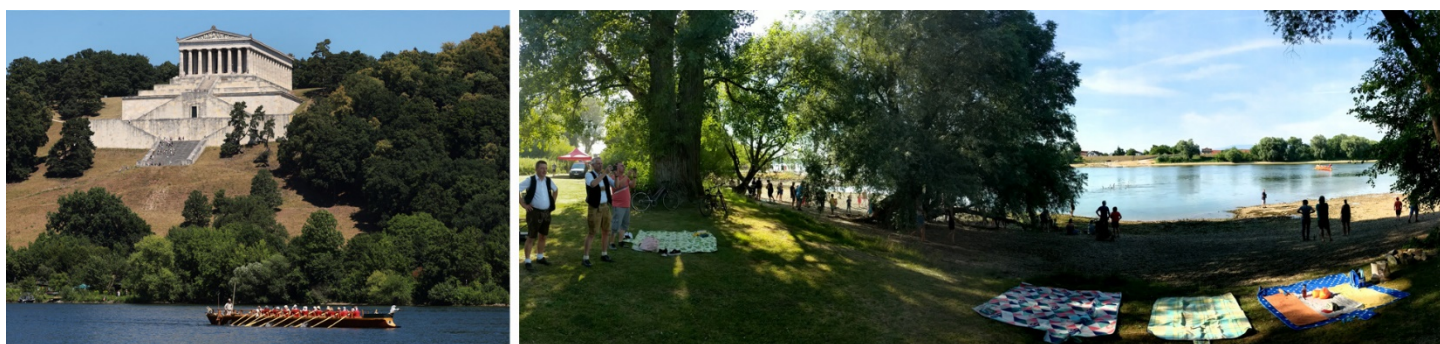
Autor slike levo: Mathias Orgeldinger; slika desno: Stephanspošing (autor slike desno: FAU)

Ovde su nas, međutim, čekale posebne okolnosti. Nije bilo odgovarajućeg prostora za pristajanje, ali je postojala trajektna služba između Stefanspošinga, na jednoj obali Dunava i Mariapošinga ( Mariaposching ), na drugoj. Plan je bio da Danuvija Alakris pristane pored trajekta. Ovo je bilo dobro rešenje i veliko olakšanje, s obzirom na dnevni rad. Međutim, morali smo biti spremni za još malo uzbuđenja. Čamac za spasavanje na vodi odvezen je u zaliv kako bi bio pored našeg čamca, ali je manevr pošao naopako. Motorni čamac je tom prilikom došao u kontakt sa naša četiri vesla, koja su još uvek bila izvučena i izložena kontaktu. Srećom, ništa se nije desilo sa čamcem za spasavanje, ali su naša vesla polomljena i morala su biti zamenjena. Kasno uveče, čamac je morao da se odvoji od trajekta i preveze na drugu obalu, u Marijapošingu, gde je mogao da prenoći.