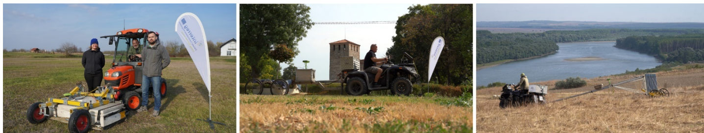
Slike: LBI ArchPro; slika levo: Hrvatski projektni partneri IAHR-a pridružuju se istraživanju GPR-a u Kopačevu; slika u sredini: GPR istraživanje kod tvrđave Baba Vida u Vidinu; slika desno: Prelep i izazovan teren na rimskoj tvrđavi Sacidava .

Unutar Rimske tvrđave, mnoge otkrivene građevine ukazivale su na bivše rimske zgrade, tok nekadašnjih zidova i ostatke zidova od opeke i crepove od cigala. U okviru ranog srednjovekovnog naselja i Getičeve tvrđave, mnoge veće jame mogle bi da ukažu na naseljavanje, u nekim slučajevima čak i na ukopane kuće. Zanimljivo je da je probno istraživanje na maloj oblasti južno od Rimske tvrđave otkrilo nekoliko pravougaonih zgrada, kao i mnoge manje jame koje bi mogle da se protumače kao grobovi. Njihovo poreklo – rimsko ili iz kasnijeg perioda – nije moglo da se utvrdi sa sigurnošću, međutim, obećavajući rezultati ohrabрили su tim da se vrati na dalje istrage u budućnosti.